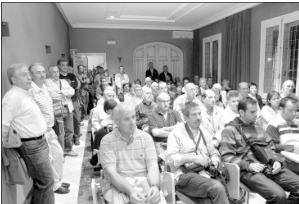
El público abarrotó ayer el salón de actos del IEA en la presentación del libro. VÍCTOR IBAÑEZ